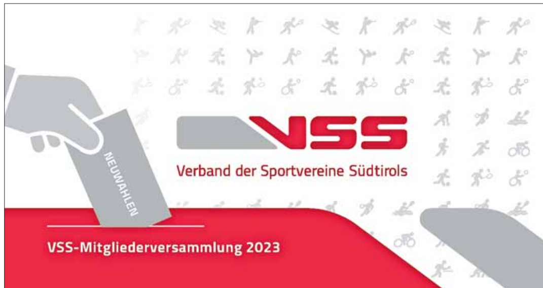
VSS lädt zur Mitgliederversammlung