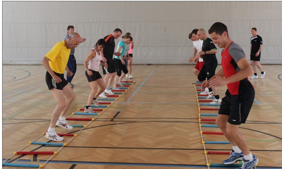
Nach einigen Jahren Pause kehrt 2024 der Lehrgang für Sportinstruktoren zurück.