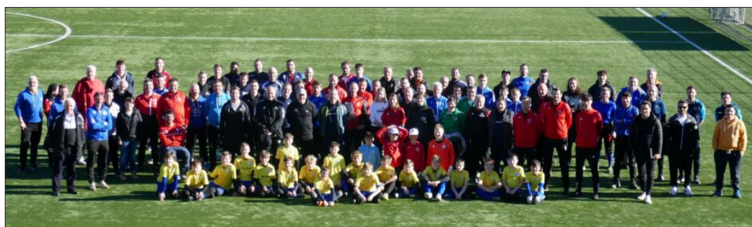
Rund 80 Teilnehmer waren beim VSS-Kurs mit den DFB-Stützpunktrainern dabei.

KURS: Ausbildung mit DFB-Stützpunktrainern mit 80 Teilnehmern