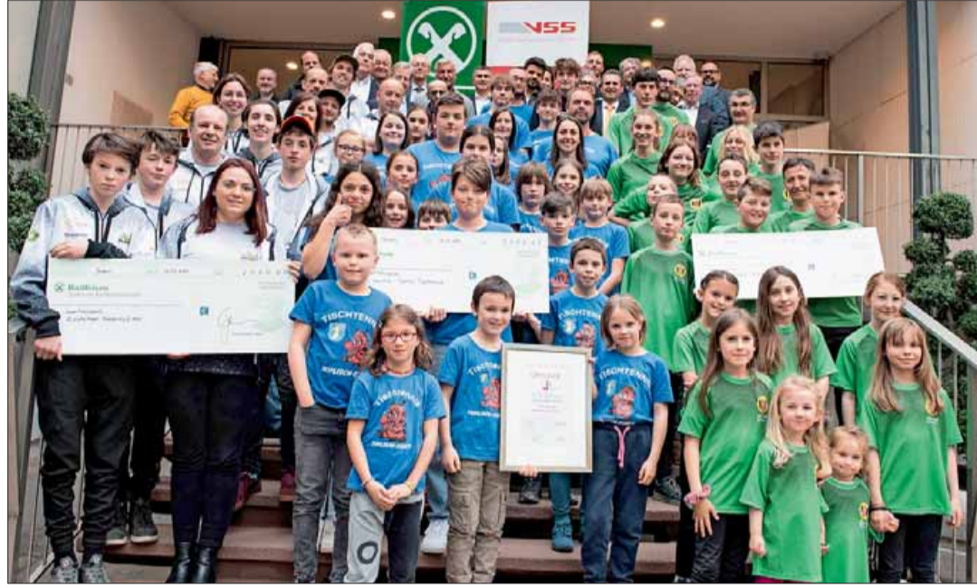
VSS sucht wieder Vereine mit vorbildlicher Jugendarbeit. Im Bild: die Siegerevereine 2022.

Die Südtiroler Amateursportvereine leisten großartige Arbeit für die Jugend unseres Landes. Um dies zu würdigen und Vereine hervorzuheben, die sich mit verschiedenen Aktionen besonders für den Nachwuchs einsetzen, hat der VSS bereits vor 23 Jahren den Wettbewerb „Vorbildliche Jugendarbeit im Sportverein“ ins Leben gerufen. Auch heuer wurde der von Raiffeisen gesponserte Wettbewerb unter den VSS-Mitgliedsvereinen ausgeschrieben.