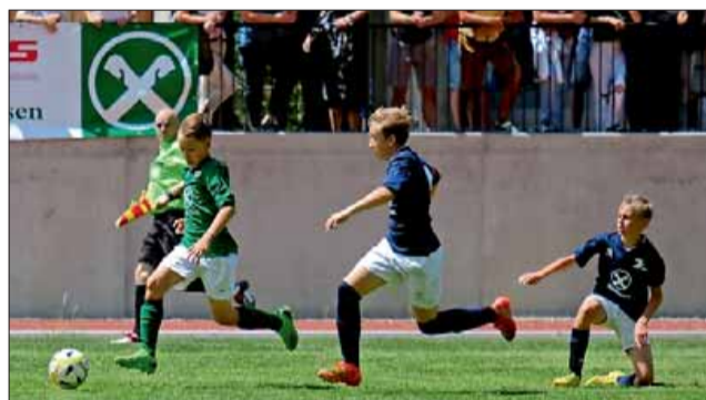
Nachwuchsfußballer freuen sich auf neue Saison.

FUSSBALL: Mannschaftsmeldungen bis 15. Juli