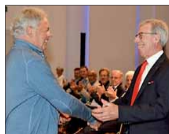
USSA-Präsident Paolo Trotter mit VSS-Obmann Günther Andergassen

Positive Beispiele aus der jüngsten Vergangenheit gibt es einige - etwa die Kooperation im Rahmen der „Eisi-Tour“, oder die Wiederaufnahme der „Erlebnissport“. Beim gemeinsamen Vorstandstreffen der beiden großen Sportverbände wurden die Gemeinsamkeiten hervorgehoben, Erfahrungen ausgetauscht