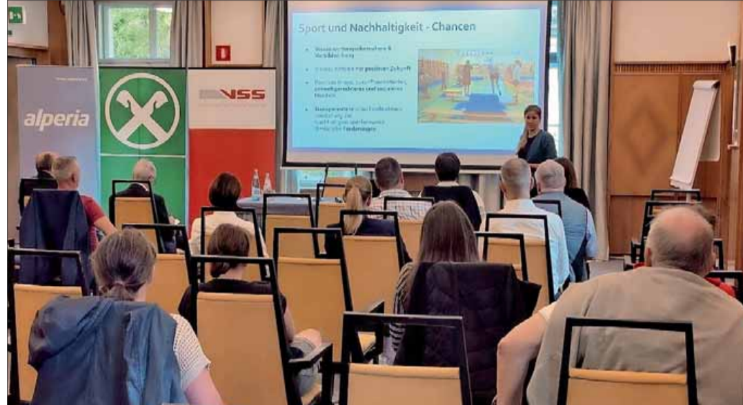
Der VSS bietet 2023 wieder ein umfangreiches Kursangebot an.