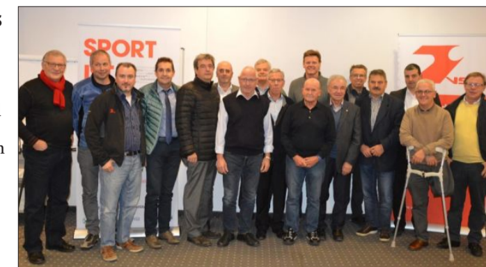
Die VSS-Referenten und die Mitglieder der VSS-Verbandsleitung leisten ebenfalls großartige ehrenamtliche Arbeit.

Insgesamt 17 Sportreferate sind im Verband der Sportvereine Südtirols (VSS) organisiert. Vom Badminton über Behindertensport, Fußball, Handball, Kanu, Kegeln, Leichtathletik, Radsport, Rangglin, Schwimmen, Seniorensport, Sportschießen, Tennis, Tischtennis, Turnen bis hin zu Volleyball und Wintersport ist für (beinahe) jeden Geschmack etwas dabei. Was viele dabei nicht wissen: Die Referenten und Ausschussmitglieder des VSS üben ihre Tätigkeit ehrenamtlich aus und sorgen