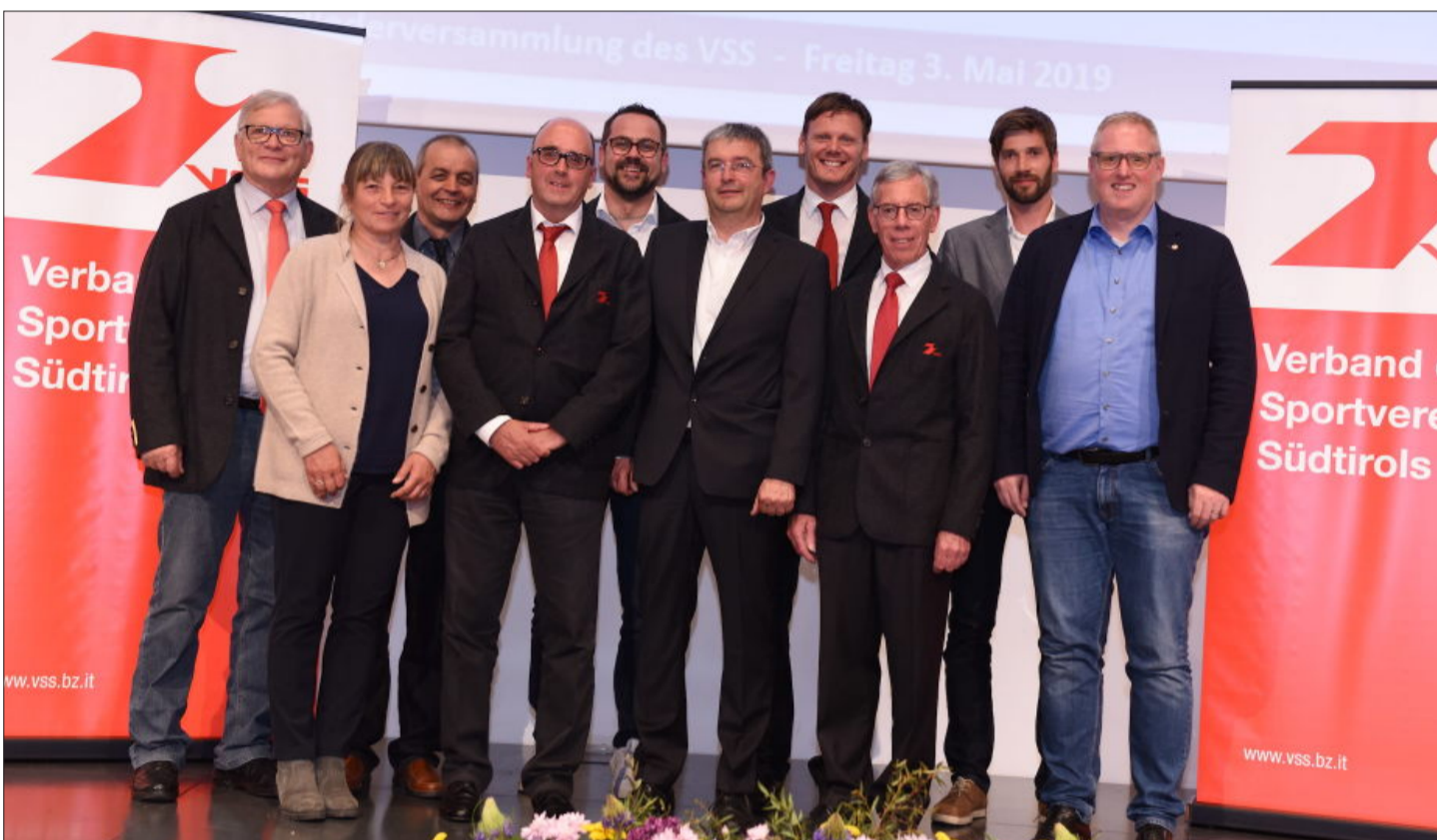
Die VSS-Verbandsleitung fordert eine entsprechende Anerkennung für die Ehrenamtlichen in Südtirols Amateursportvereinen.

Allein bei den mehr als 500 VSS-Mitgliedsvereinen gibt es rund 12.000 ehrenamtliche Mitarbeiter. Dazu hat jeder Verein bzw. jede Sektion noch unzählige Helfer, die beispielsweise bei Vereinsveranstaltungen mithelfen und damit wertvolle Hilfe leisten. Ohne sie wäre die Arbeit der Vereine und des Verbandes der Sportvereine Südtirols in der heutigen Form nicht möglich. Gleichzeitig unterstützen die ehrenamtlichen Helfer auch die Gesellschaft als Ganzes. Nirgends gelingt etwa Integration und Inklusion so leicht und spielerisch wie im Amateursportverein. Nur mit bezahlten Fachkräften ließe sich dies alles nicht ermöglichen. „Daher verdient die