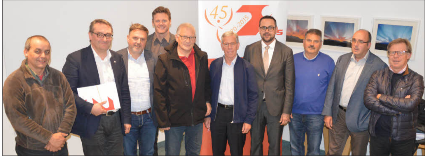
Der VSS-Vorstand konnte bei seiner Klausurtagung auf ein intensives Jahr zurückblicken. Auch 2016 sollen wichtige Programme umgesetzt werden.

„Wir wollen auch in den kommenden Jahren verstärkt den