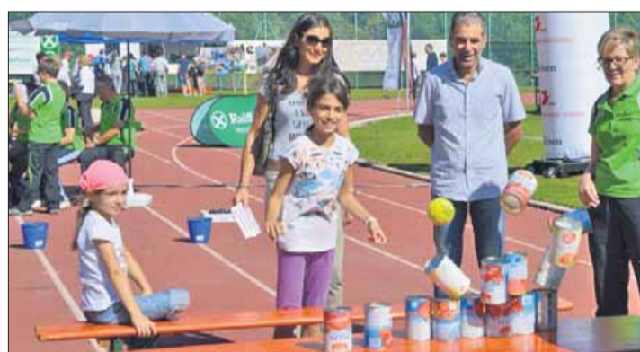
Lana wird im Herbst Austragungsort des beliebten VSS-Sportfestes sein.

Verwaltungsrat des Sonderfonds für die ehrenamtliche Tätigkeit Comitato di Gestione per il Fondo Speciale per il Volontariato