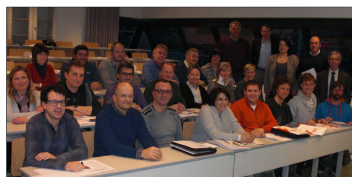
26 Sportfunktionäre „büffeln“ für mehr Qualität in der Vereinsführung.