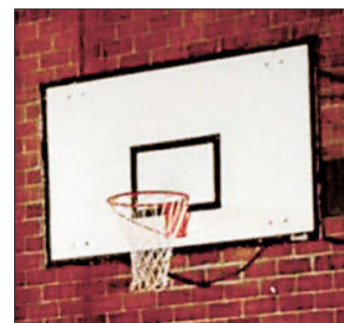
Korbwürfe auch im Sommer

Grundsätzlich kommen die Schulen für Aufsicht und Personal auf. Falls dies (z.B. im Sommer) nicht möglich ist, haben Sportvereine die Möglichkeit mit den Schulen eine Konvention abzuschließen. Dabei übernimmt der Sportverein die Verantwortung für die Struktur inklusive Aufsichts- und Reinigungsdienst. Zur Erinnerung: VSS-Mitgliedsvereine sind automatisch haftpflichtversichert.