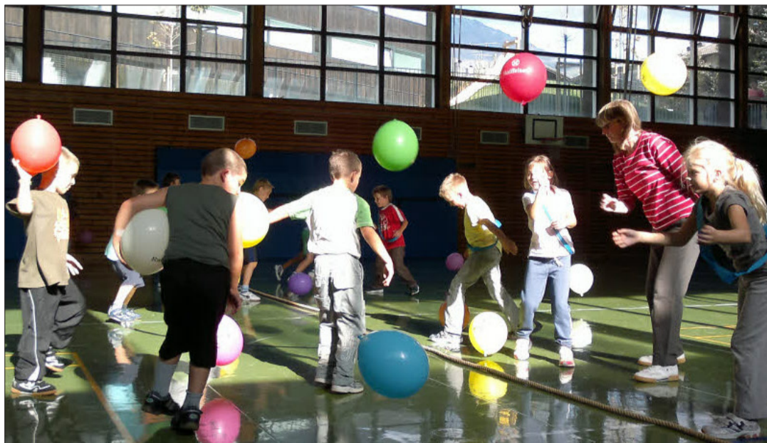
Auch Sportvereine können wertvollen, expertengestützten Unterricht an den Schulen leisten.

Der VSS hat die Beziehung zwischen Schule und Sportvereinen seit 2006 in regelmäßigen Abständen bei Tagungen und Workshops erörtert. Tatsache ist, dass die Sportvereine derzeit den Musikschulen nicht gleichgestellt sind. Während die Schule den Besuch einer Musikschule als Wahlpflichtfach anerkennen kann, geht das bei Sportvereinen