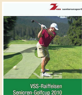
VSS-Raiffeisen Senioren-Golfcup 2010

Der großen Festakt der Mini-WM erfolgt am Freitag, 28. Mai ab 17.30 Uhr in die Sportzone Altenburg in Kaltern. Dort kann man u.a. auf die Torwand schießen, seine Schussstärke messen lassen oder beim Bungee Jumping den Nervenkitzel suchen.