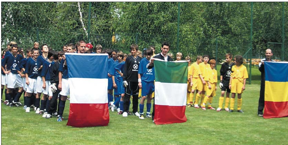
U13-Auswahlen aus neun Nationen machen die VSS-Mini-WM auch zu einem Fest der Begegnung.

25 Mannschaften aus Italien, Deutschland, Österreich, Polen, Tschechien, Slowenien, Kroatien, der Slowakei und der Schweiz - darunter auch die sechs Bezirksauswahlen des VSS und eine Mannschaft des FC Südtirol - bestreiten dieses Turnier für U13-Auswahlen (Jg. 1997 und jünger). Die Mini-WM wird nach dem Vorbild der „richtigen“ WM ausgespielt. Per Losentscheid wird jeder Mannschaft eine WM-Nation zugelost. „Allerdings haben wir nur drei Mannschaften in jeder Vorrundengruppe, weil einige