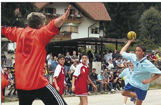
In der Pionierzeit wurde die VSS-Meisterschaft im Freien ausgetragen.

Genauso schnell nahm die Zahl der Vereine auch wieder ab, denn „zum einen war der Fußball als Mannschaftssport zu domi-