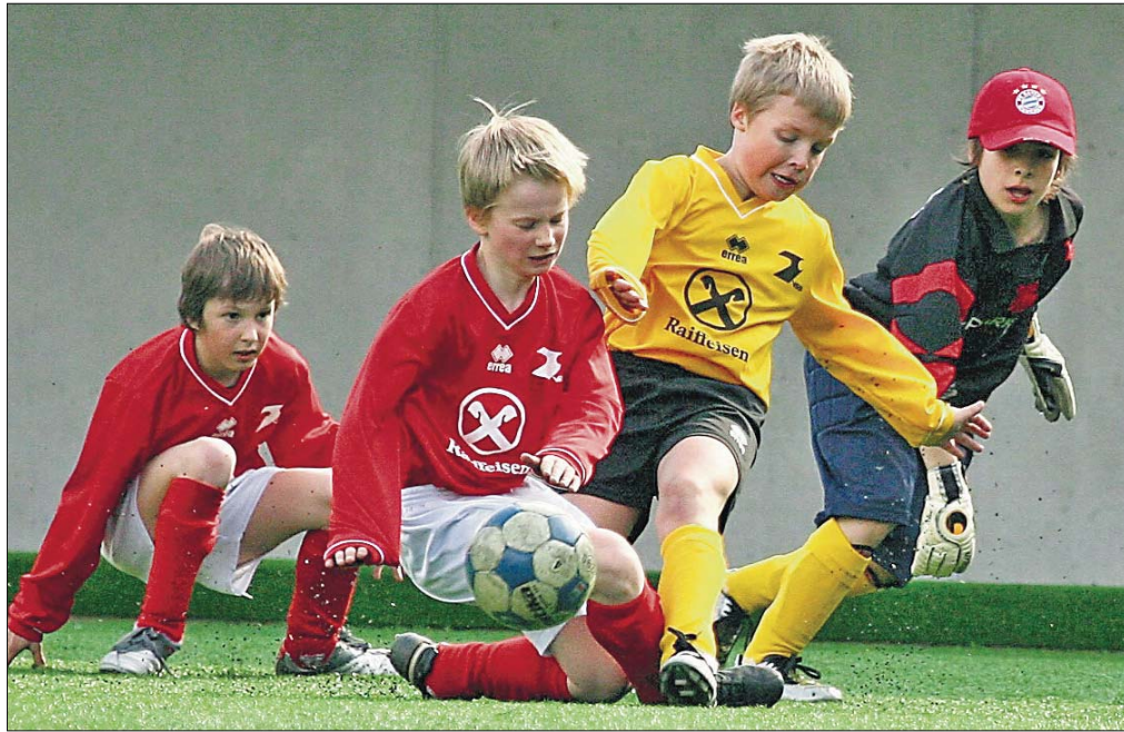
Fußball ist nach wie vor die meist praktizierte Sportart in Südtirol.