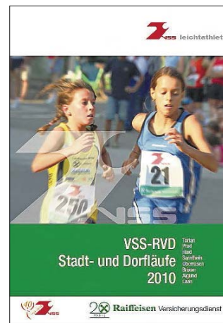
VSS-RVD Stadt- und Dorfläufe 2010

BOZEN. Am 18. April fällt heuer der Startschuss zu den Stadt- und Dorfläufen. Neu im Programm sind die Läufe in Terlan (Saisonauftritt) und Brixen (Bahn). Die Landesmeistertitel werden am 9. Mai in Prad vergeben. Das Finale steigt am 19. September in Laas. Zum Programm gehören auch die traditionell stark besetzte Haider-See-Umrandung am 2. Juni, der Abendlauf am 24. Juli in Sarnthein sowie die Läufe in Oberrasen (7. August) und Algund (12. September). Die neue Broschüre liegt in der Geschäftsstelle auf und ist auch auf unserer Internetseite abrufbar.